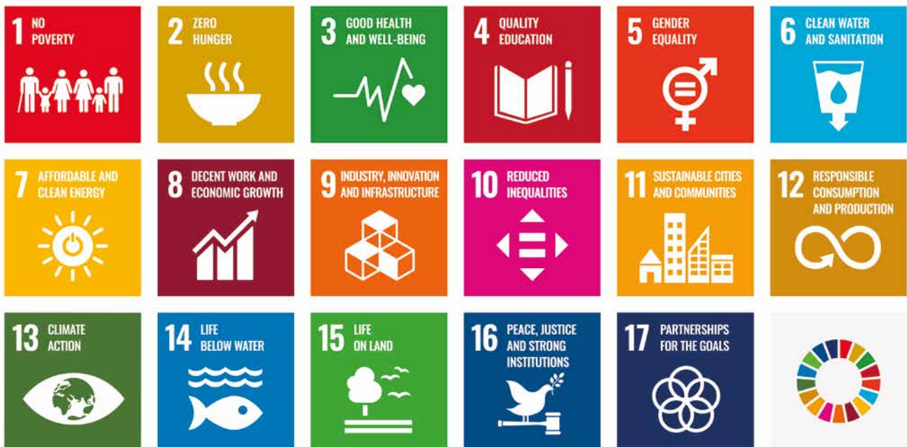
FIGUUR 1: DE 17 SUSTAINABLE DEVELOPMENT GOALS VAN DE VN